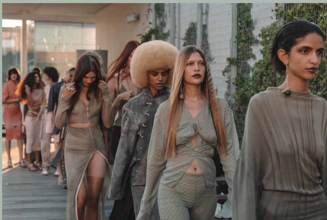
Backstage vid Jade Cropper x Circulose® SS2023

*Ett minusbelopp redovisas i det fall likvida medel överskrider räntebärande skulder.